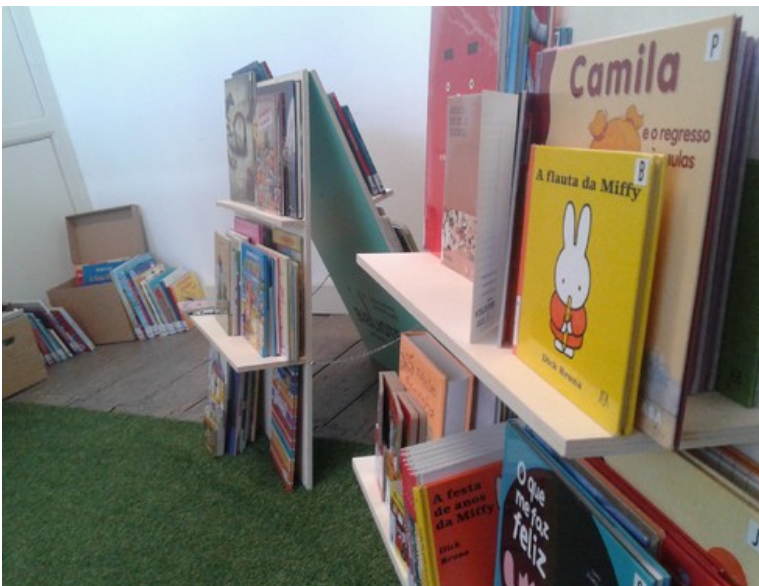
Alguns dos livros disponíveis