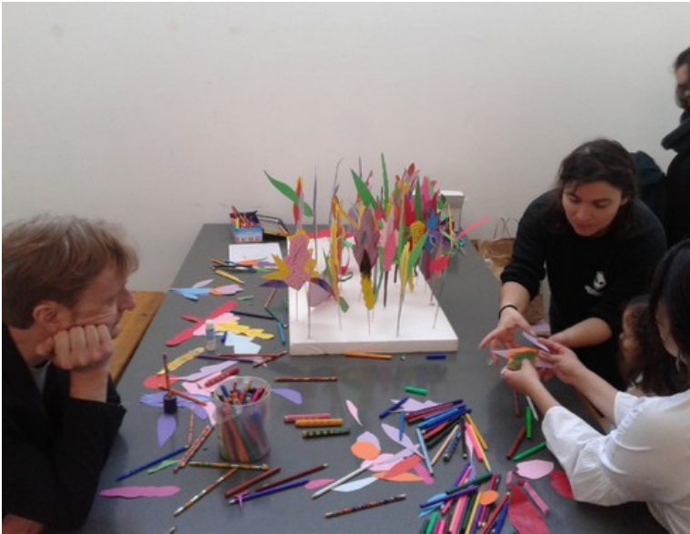
Pintura, recorte e colagem são outras das actividades do espaço cultural

Com parcerias das escolas portuguesas de Amsterdam, Rotterdam e Den Haag, deslocam-se por vezes a estas para actividades com os miúdos. De início, com uma pequena caixa de livros, têm hoje alguns problemas de logística neste tipo de deslocações, com as já centenas de obras infantis que possuem.